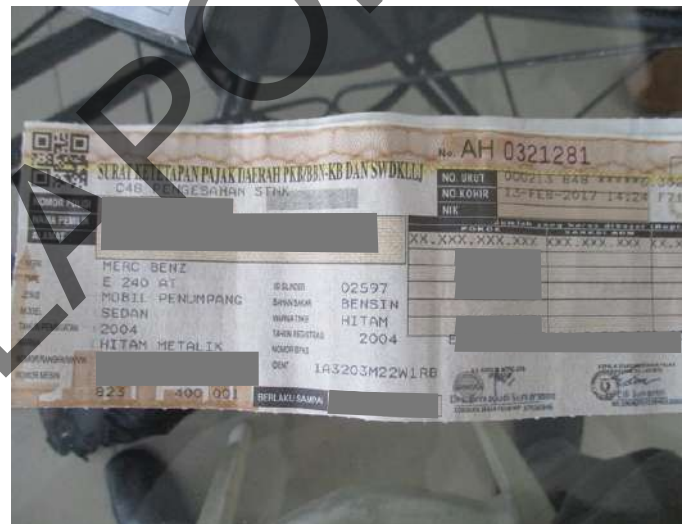
Keterangan: Lembar Pajak

No. AH 0321281 SURAT SETAPAN PAJAK DAERAH PKR/BBY-KB DAN SWDKLLJ C48 PENGESAHAN STNK NO. BUKET : 000215 BAB 00000000000000000000 NO. KOPRI : 13-FEB-2017 14:22K 173 MERK : MERCEDES BENZ TYPE : E 240 AT BENSIN : MOBIL PENUMPANG MODEL : SEDAN TAHUN PEMBUATAN : 2004 ISI SILINDER : 02597 NOMOR BANGKANG/NGAUN : [REDACTED] NOMOR MESIN : [REDACTED] WARNA : HITAM METALIK BAHAN BARAN : BENJIN WARNA TIRIB : HITAM TAHUN REGISTRASI : 2004 KODE LOKASI : 1A3203M22WLRB BERLAKU SAMPAI : [REDACTED]