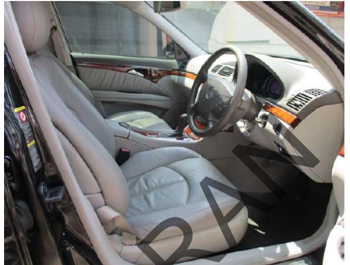
Keterangan: Interior depan