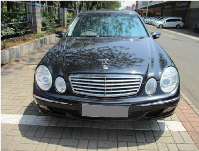
Keterangan: Eksterior depan