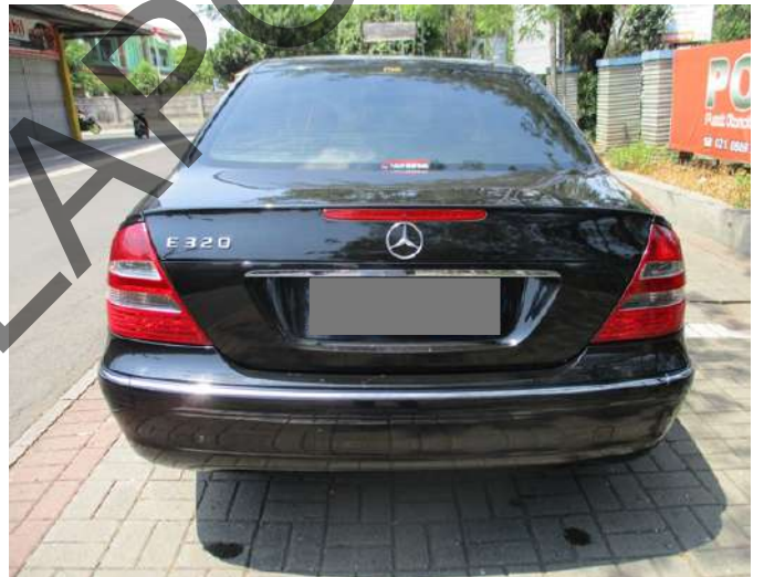
Keterangan: Eksterior belakang