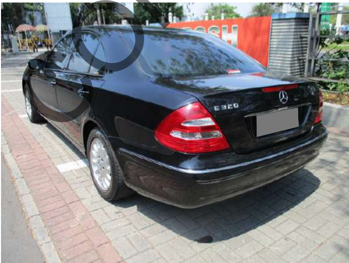
Keterangan: Kiri belakang