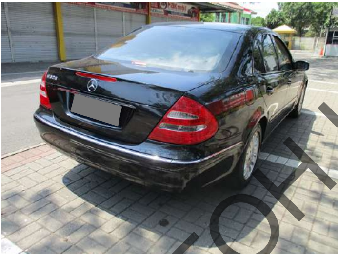
Keterangan: Kanan belakang