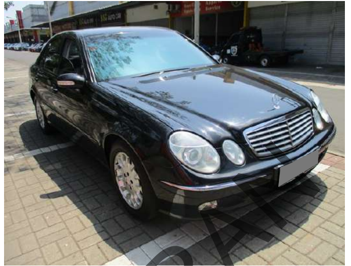
Keterangan: Kanan depan (utama)