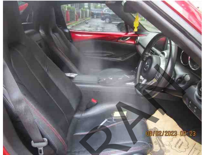
Keterangan: Kabin depan